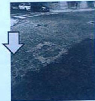
RESTO de CONCRETO

COMISIÓN DE MANTENIMIENTO BARRIAL del CCCC 7