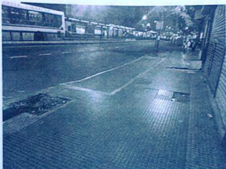
Frente de la propia sede comunal 7