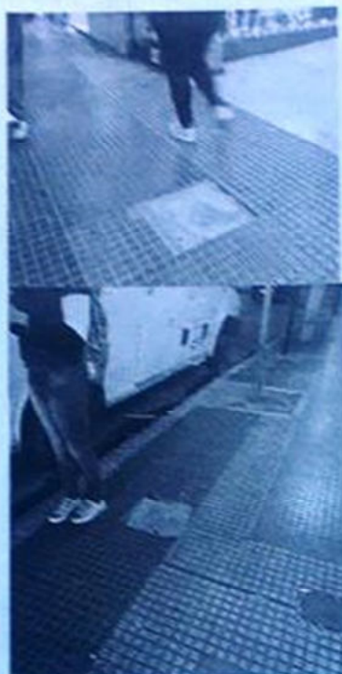
Entrada de comercio