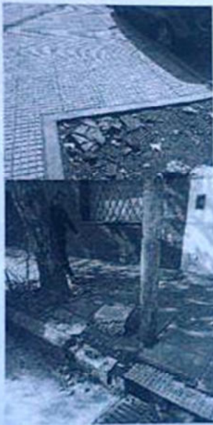
RESTOS de ASFALTO TAPA inspeccion AYSA OBSTRUIDA

Evidentemente nadie de la comuna controla ni a esta gente ni a estas empresas, las que operan como si el territorio les fuese propio. Cabe agregar que ningún funcionario comunal asignado a responsabilidad de espacio publico se hizo presente durante las actividades de la obra.