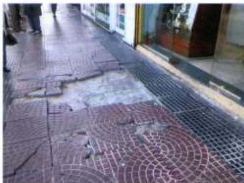
COMISION DE MANTENIMIENTO BARRIAL del CONSEJO CONSULTIVO COMUNAL de la COMUNA 7

Se adjunta "foto testigo" del estado actual de la misma .